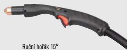
Ruční hořák 15°