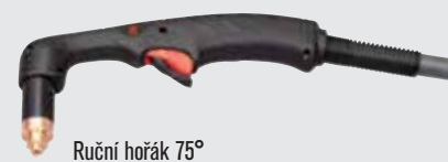
Ruční hořák 75°

(více volitelných možností hořáku viz www.hypertherm.com )